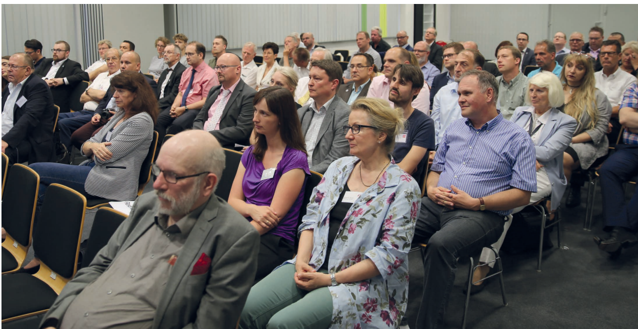
Publikum Podiumsdiskussion