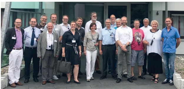
Teilnehmer Betriebsbesichtigung FACKELMANN Therme