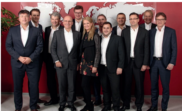
FACKELMANN GmbH + Co.KG - Das Management Team

Auch die Betriebsbesichtigung in Hersbruck bei der FACKELMANN THERME war ein voller Erfolg. FACKELMANN GmbH + Co.KG ist ein familiengeführter, mittelständischer Unternehmensverbund mit langer Tradition. Die Firma besitzt 39 Produktions- und Vertriebsstandorte weltweit und ist Weltmarktführer für Küchenhelfer/Backformen. Hinzu kommt die Deutsche Marktführung für zerlegte Badmöbel. FACKELMANN ist Sponsor von Axel Schulz, Ice Tigers Nürnberg, HC Erlangen, 1. FCN Tennis, Kinderfonds-Stiftungen und Miniköche Hersbruck. Sie zeigen nicht nur für die FACKELMANN Therme soziales Engagement sondern auch für Kinderfonds-Stiftungen und Miniköche Hersbruck.